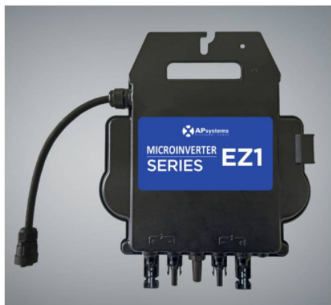
Micro onduleur solaire EZ1-M APsystems - 20A - 2PV - WIFI Réf 132018