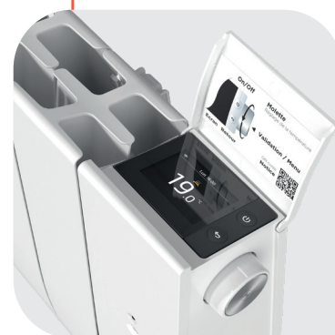
Boîtier de commande ergonomique