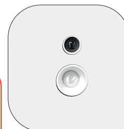
Système de détection combinant un capteur infrarouge (mouvement) et un capteur de luminosité