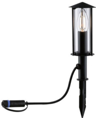
Borne Classic Luminaire Paulmann - Anthracite - 22cm - 2W - 3000K - IP44 Réf 94323