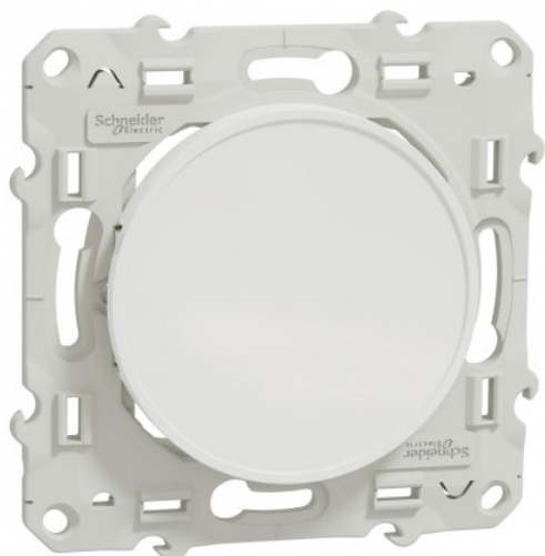
Obturateur à griffes Odace Schneider Electric - Blanc Réf S525666