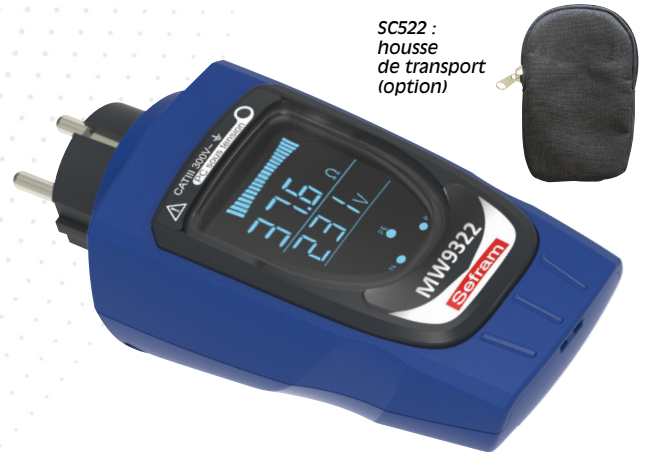
SC522 : housse de transport (option)