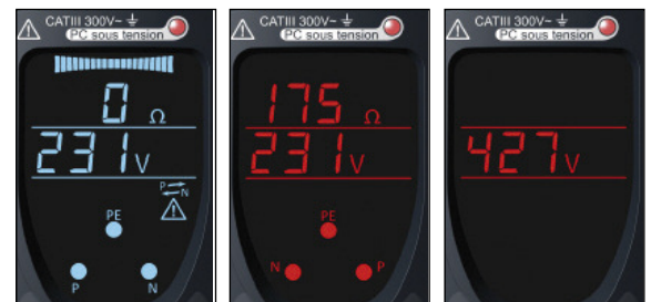
Prise mal câblée: phase présente sur PE