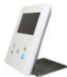
F09420 SUPPORT BUREAU MONITEUR VEO- XS/VEO-XL