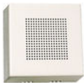
F02040 PROLONGATEUR APPEL ÉLECTRONIQ.