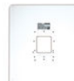
F03389 PLAQUE DE PROPRETÉ UNIVERSELLE GRANDE