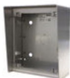
F04645 BOÎTIER EN SAILLIE MARINE ST1