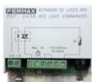
F02438 ACTIVATEUR SONNETTE OU ECLAIRAGE VDS