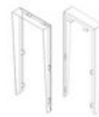
F04701 VISIÈRE MARINE ST1