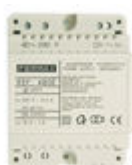
F04802 ALIMENTATION DIN4 230VAC/12VAC-1A