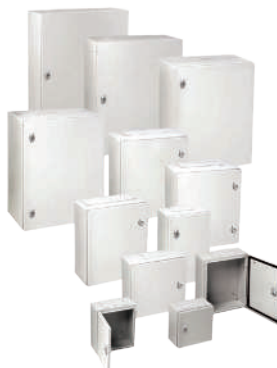
COFFRET POLYESTER IP66 - IK10