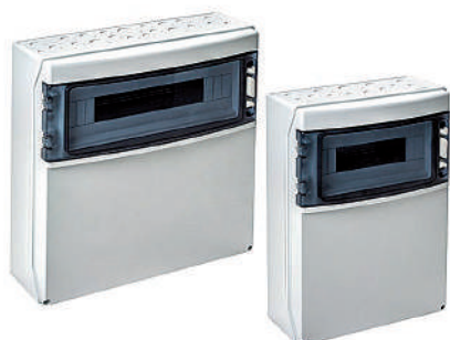
COFFRET ABS IP65 - IK08