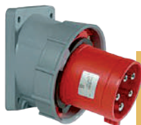
IP IP44 IP67