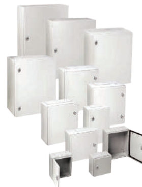
COFFRET MÉTALLIQUE IP66 - IK10