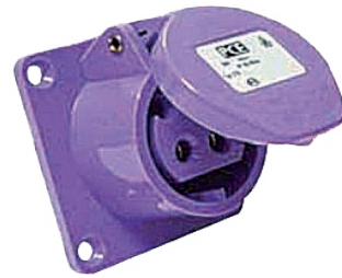
Prise 24 V