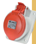
IN 16 A 32 A 63 A 125 A