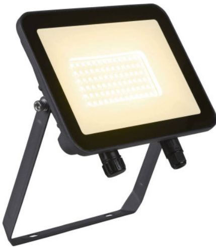
Projecteur LED pivotant Floodi L SLV - 48W - 3000K - IP65 - Anthracite Réf 1006193