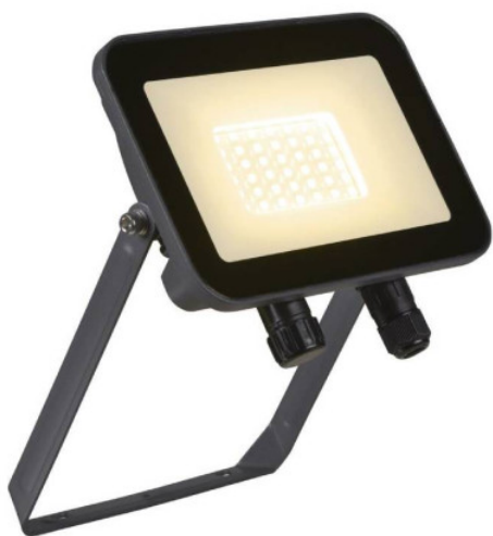
Projecteur LED pivotant Floodi M SLV - 30W - 3000K - IP65 - Anthracite Réf 1006192